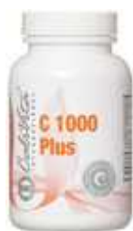
Vitamina C 1000 Plus