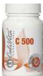
Vitamina C 500